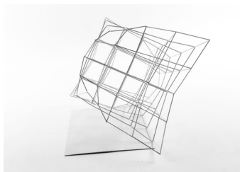
jetlira loshaj: Übung 3dg, ws 17

Der ästhetische Wert der Formstudie wird ganz wesentlich von der angemessenen Behandlung des jeweils gewählten Materials bestimmt. Dazu zählen handwerkliche Präzision in der Ausführung, Abstraktionsgrad oder auch die durch Licht und Schatten bestimmten Oberflächenmerkmale (Struktur, Textur aber auch Kanten, Konturen, Konvexitäten und Konkavitäten, Rauigkeit, Glanz etc.). Wählen Sie Materialien, die Sie beherrschen und arbeiten Sie so einfach und effizient wie möglich. Zur Unterstützung der Ganzheit Ihres Objekts ist ein homogenes Erscheinungsbild gewünscht, vorzugsweise in Weiß. Achten Sie auf Stabilität und Transportierbarkeit Ihres Objekts. Vermeiden Sie objektfremde Stütz- und Hilfskonstruktionen. Das Präsentationsobjekt soll in seiner kompositorischen Entwicklung im Raum und in Bezug auf Form und Inhalt überzeugen und für sich selbst sprechen.