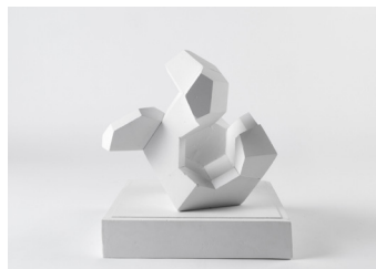
lukas hansmann: Übung 3dg, ws 17