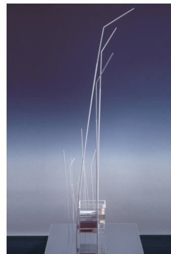
reed house, r. horden, m. de goey

in der woche vom 07. bis 12. januar beim jeweiligen betreuer oder betreuerin am institut.